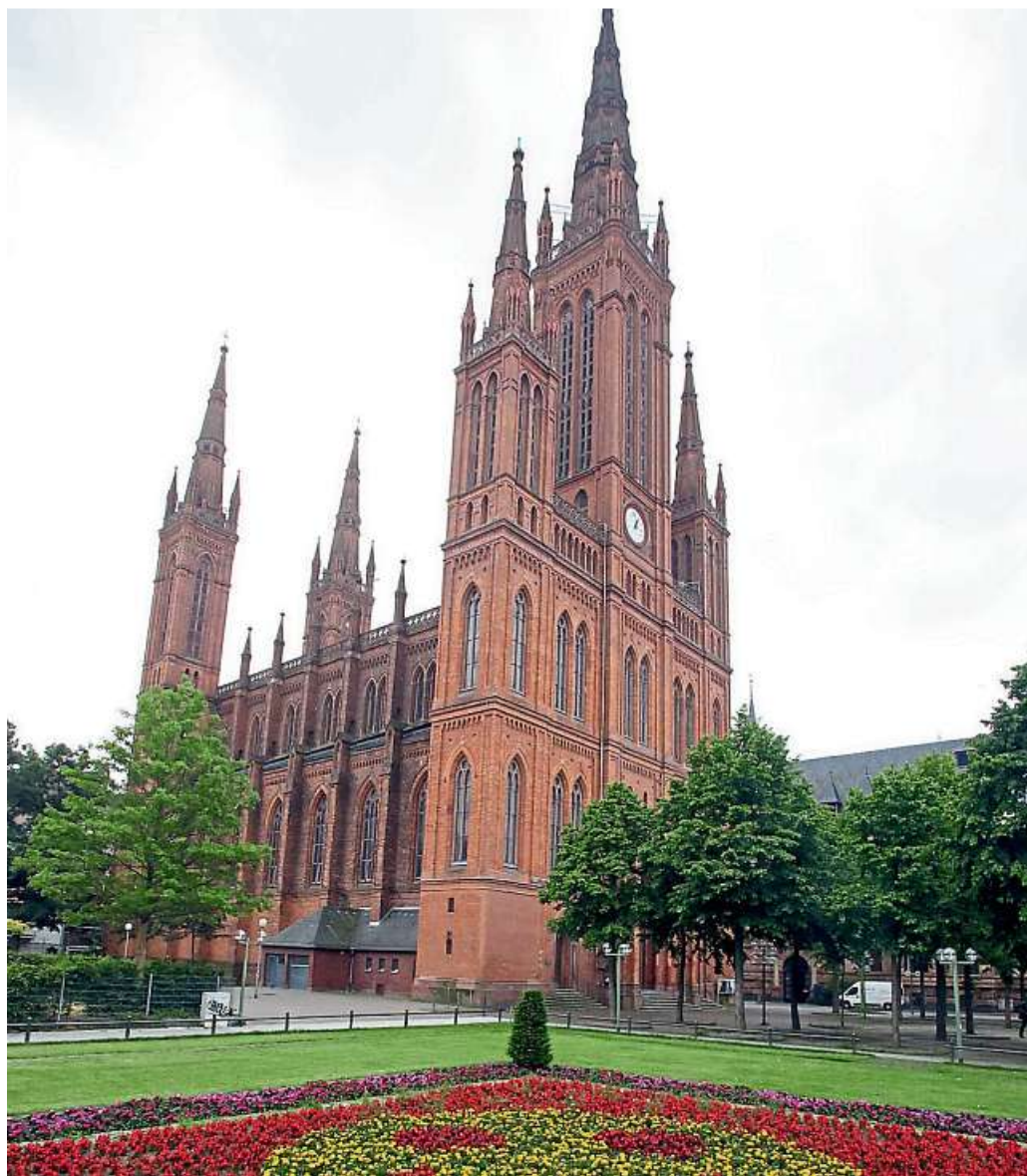
Die Marktkirche ist mit ihrem Carillon auch ein klangliches Wahrzeichen der Stadt.

Finanzielle Unterstützung kam von mehreren Seiten: Der Förderverein „Kirchenmusik der Marktkirche“ hat 1500 Euro beigetragen, die Nassauische Sparkasse 8000 Euro, die Staatskanzlei 2000 Euro und die Harald-Genzmer-Stiftung 12500