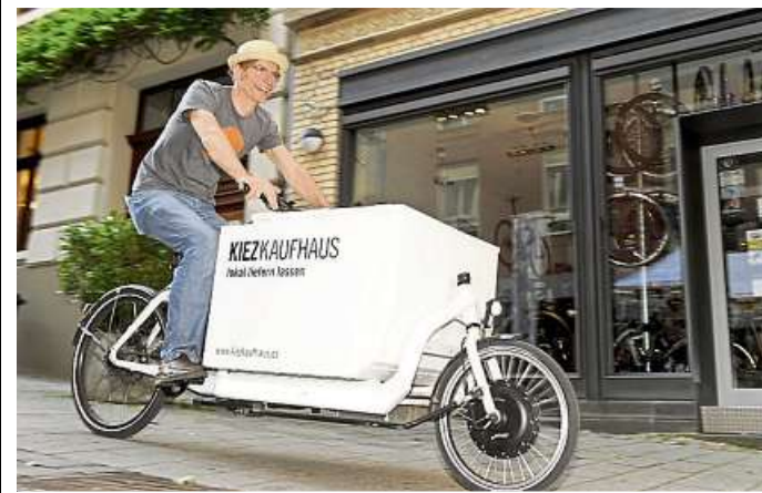
Online bestellt, von örtlichen Geschäften mit dem Lastenrad geliefert. Das „Kiezkaufhaus“ sieht das Internet nicht als Problem, sondern als Chance für den lokalen Handel.