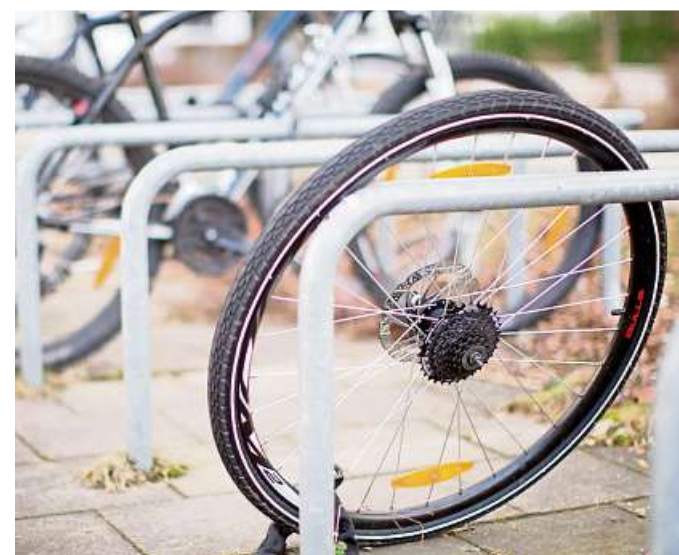
Oft stehlen Fahrraddiebe einzelne Komponenten, um sie zu verkaufen.