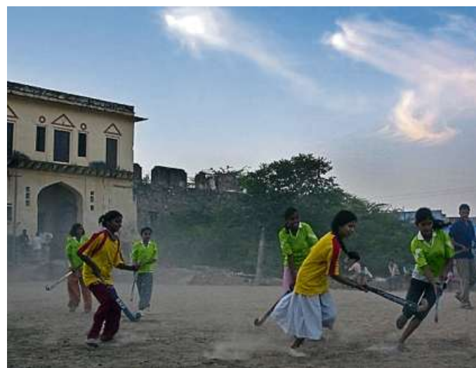
Hockeybegeisterte Kinder im indischen Rajasthan.

Im WTHC hat man etliches an Hockeyequipment gesammelt, um das Hockey Village zu unterstützen. Einen Teil wird Tumshirn direkt mitnehmen, ein anderer Teil wird später nach Indien gelangen. Weitere Spenden und Jahrespatenschaften mit Wiesbadener Absender werden wohl zukünftig Tumshirns Projekt unterstützen. Und auch weitere Volonteers.