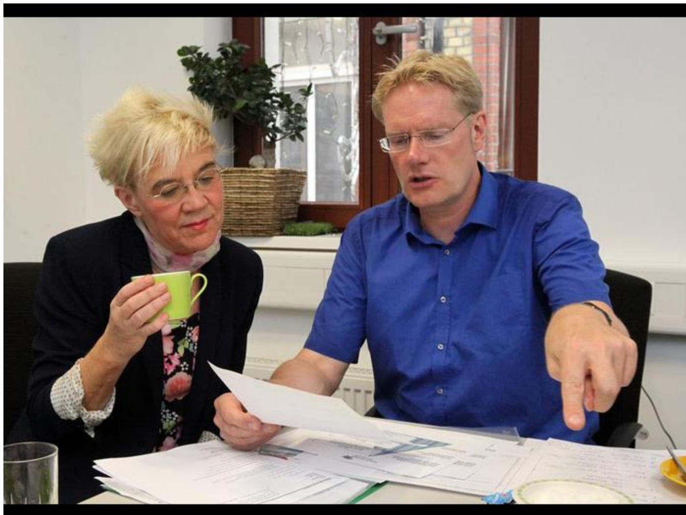
Von Patrick Körber

WIESBADEN - Die Bilanz ist beeindruckend: In fünf Jahren seit seinem Bestehen hat das Bürgerkolleg Wiesbaden 246 Veranstaltungen für Teilnehmer aus 600 Vereinen durchgeführt. 3203 Menschen besuchten die Kurse, die Vereinsmitglieder in ihrer ehrenamtlichen Tätigkeit unterstützen. Doch auch wegen des großen Zuspruchs des kostenlosen Angebots für Vereine sorgt sich