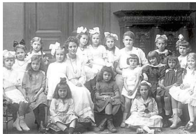
Das Foto zeigt die Klassen 9 und 10 von 1919 der Mädchenschule auf dem Schlossplatz.

► Die Stadtteilhistoriker Wiesbaden sind ein Projekt der Wiesbaden-Stiftung in Kooperation mit der Stiftung Polytechnische Gesellschaft Frankfurt und dem Kulturfonds Rhein-Main. Weitere Informationen im Internet unter www.stadtteilhistorikerwi.de und auf Facebook unter dem Stichwort stadtteilhistoriker-wi .